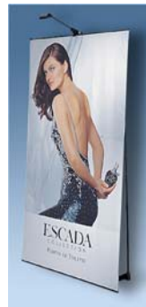
ChronoExpo 2 Displays sind in sieben Breiten lieferbar: 30, 40, 60, 80, 90, 100 und 120 cm. Beim einseitigen System Höhen zwischen 160 und 220 cm.