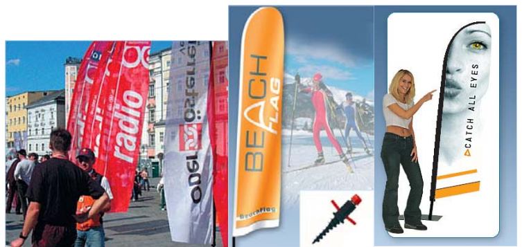
BeachFlag (5 m Höhe) mit schraubbarem Bodendübel DecoFlag (2,20 m Höhe) mit Metallfuß