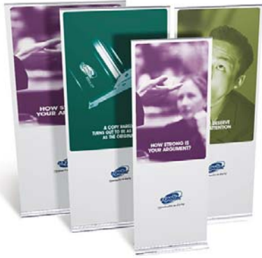
Roll Up Classic in verschiedenen Breiten und Höhen