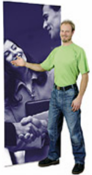
4Screen Classic in vielen Breiten und Höhen XL mit 2 Stangen